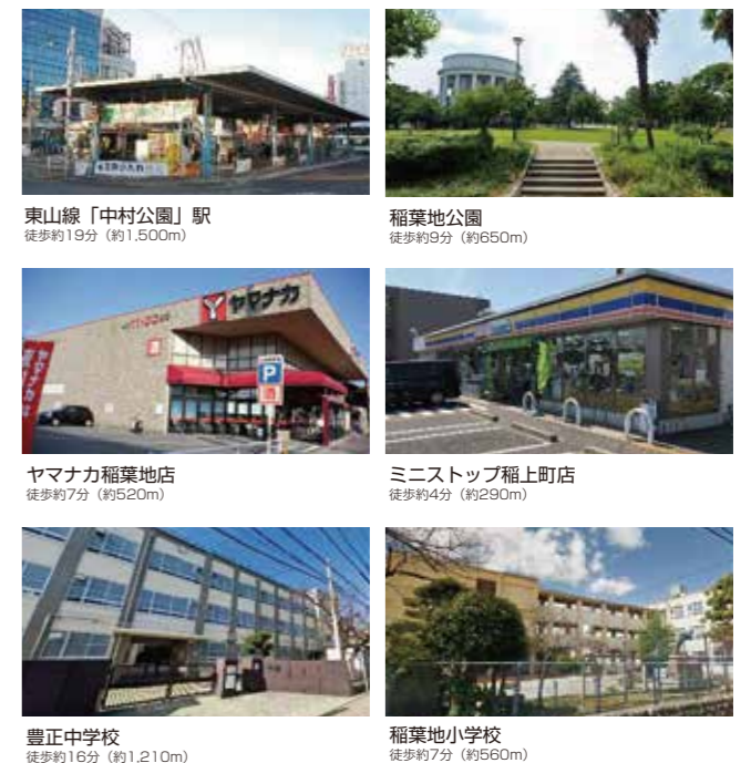
東山線「中村公園」駅 徒歩約19分(約1,500m)