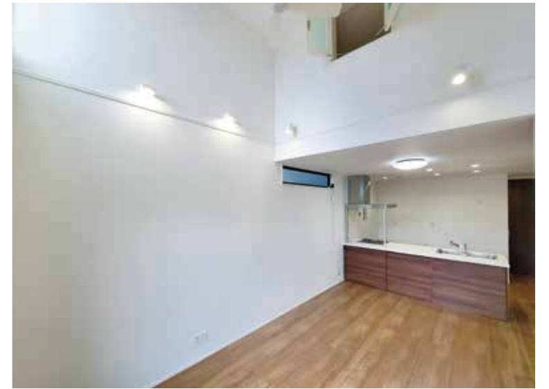
リビング(吹き抜け)

宅地建物取引業登録 愛知県知事(6)第17534号 建設業許可登録 (般-27)第101276号 一般建築士事務所 愛知県知事(4-29)第11616号(財)性能保証住宅登録機構1-12301第006546号(公)愛知県宅地建物取引業協会会員 愛知不動産公正取引協議会加盟(一社)東海住宅産業協会正会員 (一社)日本住宅建設協会正会員