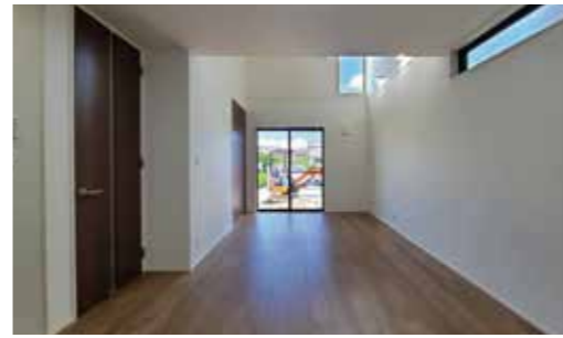
吹き抜けのあるリビングダイニング