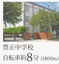
豊正中学校 自転車約8分(1800m)