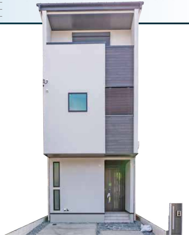
●広告作成年月日/令和2年3月10日 ●広告有効期間/令和2年3月31日

駅や学校、スーパー、コンビニなどが 徒歩10分圏内に揃う。 まるでマンションのような便利な立地です。