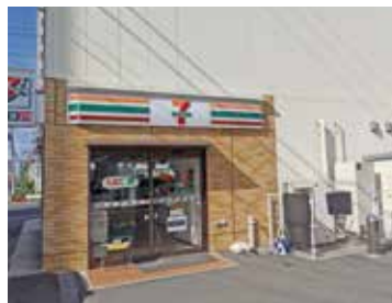
セブンイレブン 徒歩5分

駅や学校、スーパー、コンビニなどが 徒歩10分圏内に揃う。 まるでマンションのような便利な立地です。