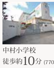
中村小学校 徒歩約10分(770m)