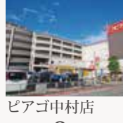
ピアゴ中村店 徒歩約6分(441m)