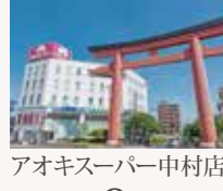
アオキスーパー中村店 自転車約3分(726m)