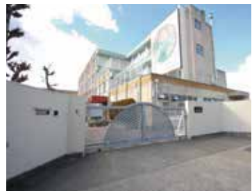
中村小学校 徒歩10分

マイホームは快適で、安全・安心で、何より家族が健康に暮らせることが一番です。 Crestonホームで「家族をする」 マイホームの夢をかなえられるよう、多様な夢のひとつひとつに応えるため、 住まいづくり、「満足の頂点」【Creston】を追求して参ります。