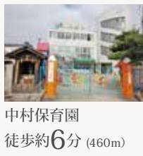
中村保育園 徒歩約6分(460m)