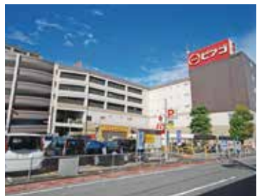
ピアゴ中村店 徒歩6分