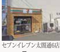
セブンイレブン太閤通6店 徒歩約5分(349m)