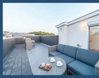
※写真は当社施工イメージです。

階段を上れば、そこに広がるのは、極上のプライベートガーデン。人目を気にすることなくリラックスした時間を過ごしてください。CrestNホームの屋上庭園「そら」で家族の思い出をたくさん作りましょう。